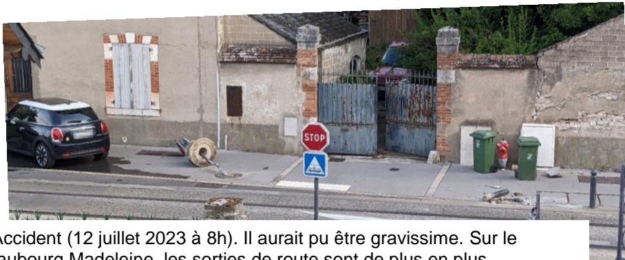
Accident (12 juillet 2023 à 8h). Il aurait pu être gravissime. Sur le faubourg Madeleine, les sorties de route sont de plus en plus fréquentes

N'hésitez pas, faites nous part de votre ressenti, photos à l'appui si besoin.