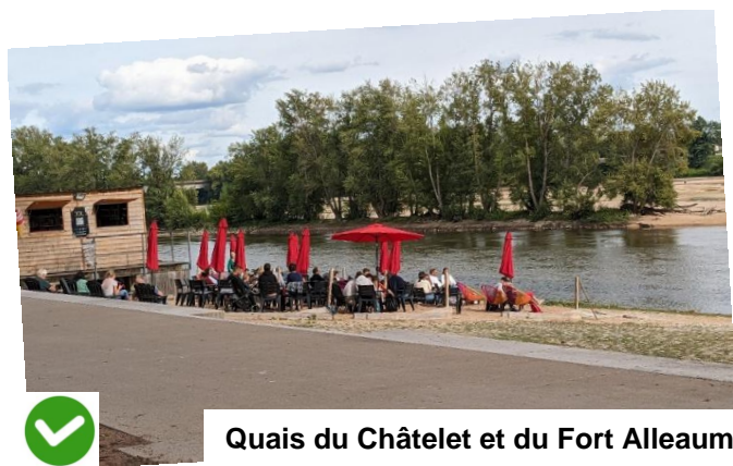
Quais du Châtelet et du Fort Alleaume

- Nous demanderons prochainement à être reçus par M. le Maire d'Orléans pour lui remettre la pétition, en espérant qu'un dialogue constructif puisse s'instaurer et que le bon sens puisse l'emporter !