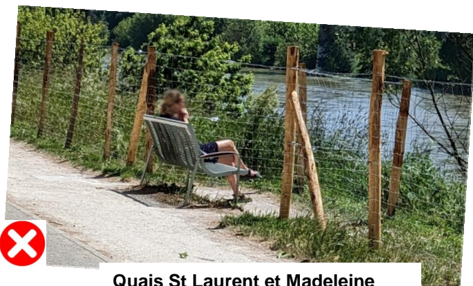
Quais St Laurent et Madeleine