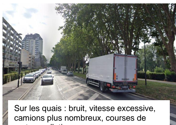
Sur les quais : bruit, vitesse excessive, camions plus nombreux, courses de motos, pollution ... Des mesures s'imposent et sont réclamées par les riverains