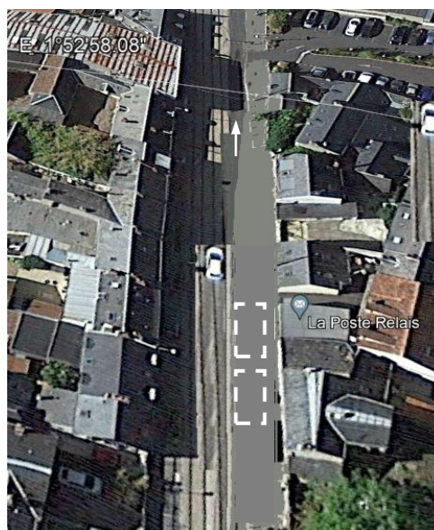
Solution proposée (photomontage)