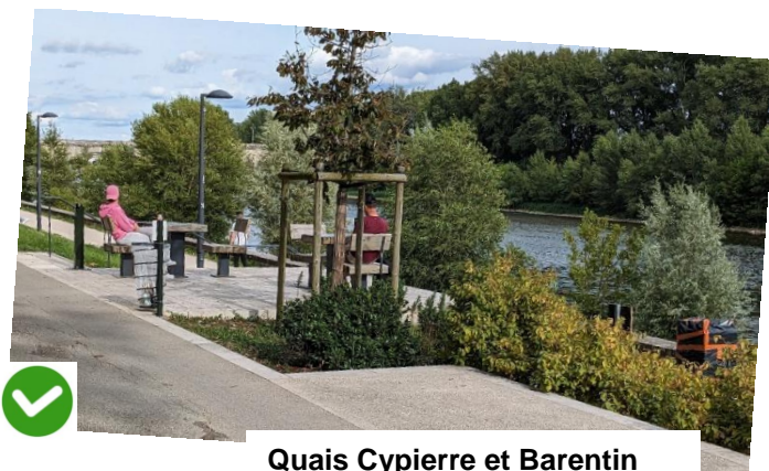
Quais Cypierre et Barentin