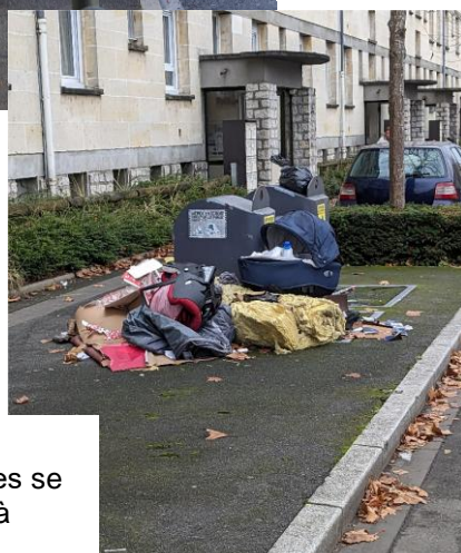
Les dépôts sauvages d'encombrants et d'ordures se multiplient et se répètent à certains endroits