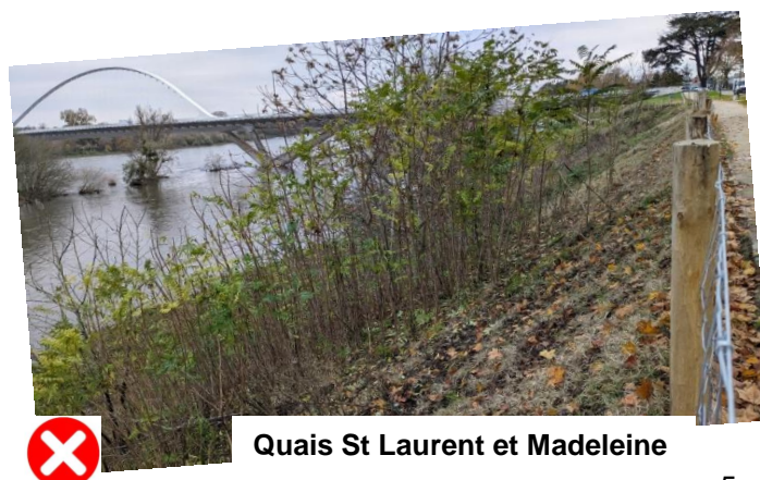
Quais St Laurent et Madeleine